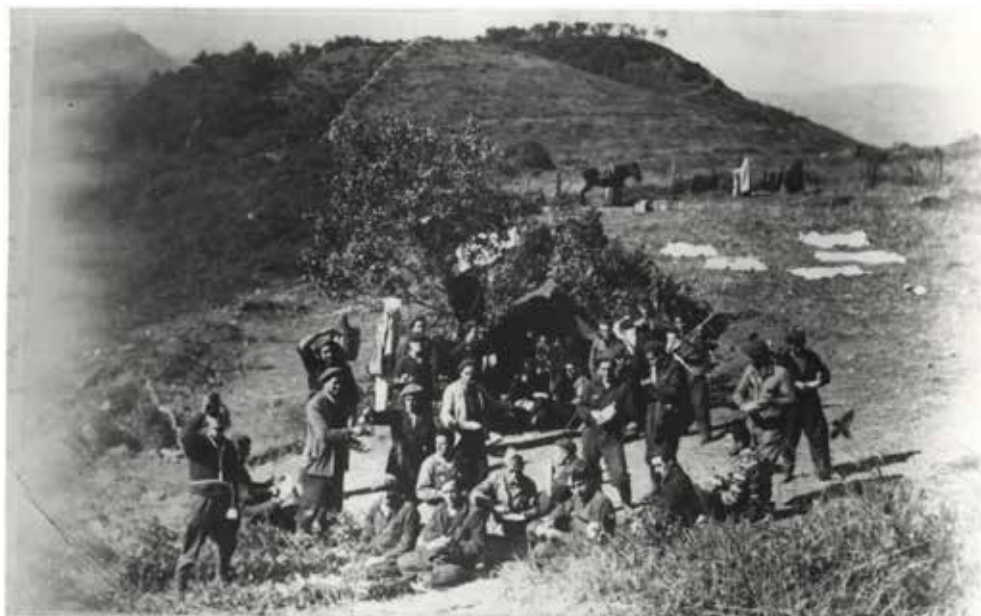
Milicianos del batallón 13 de la UGT, Baracaldo-Martínez de Aragón, disfrutando del descanso que les han concedido