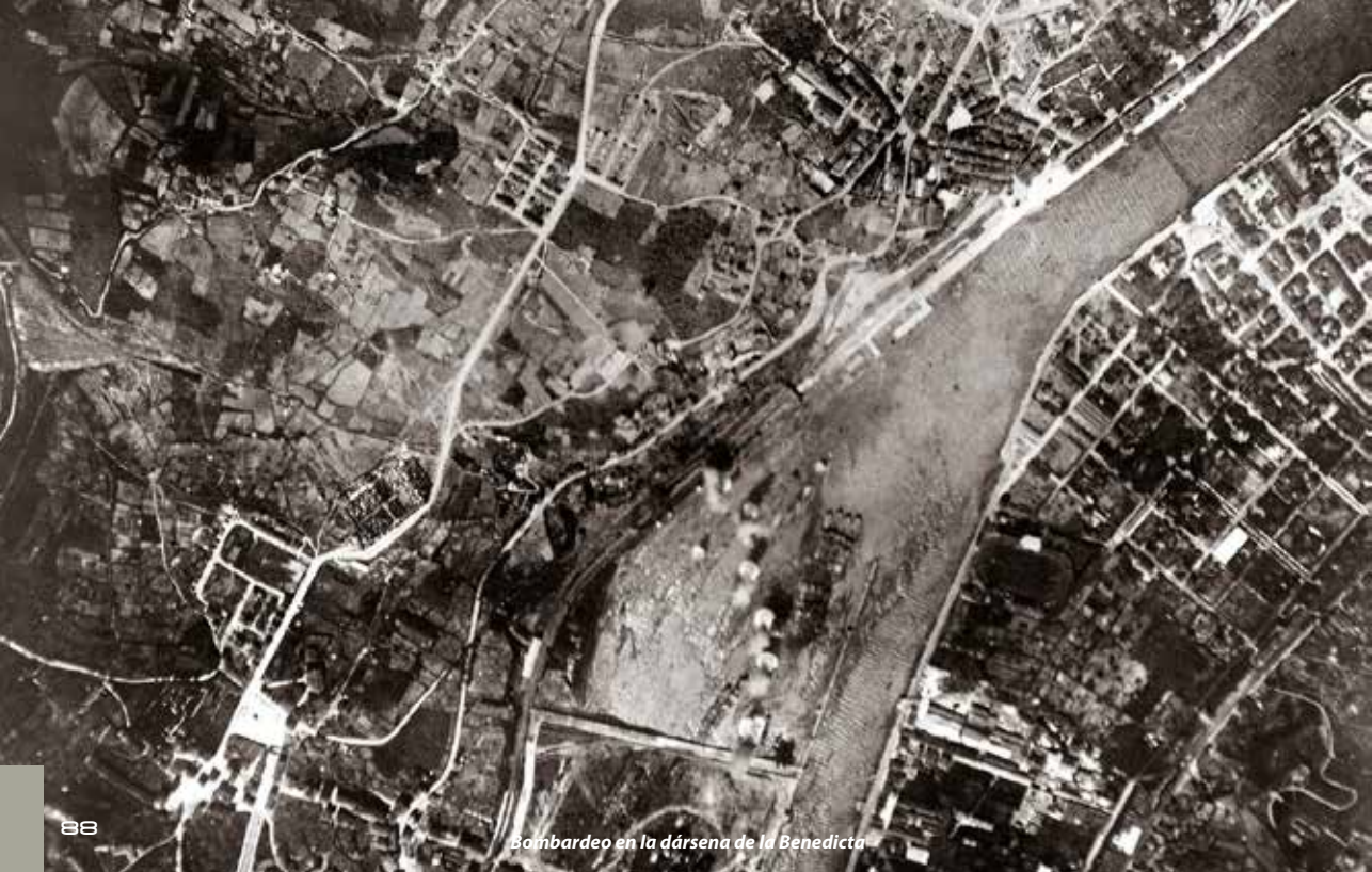
Bombardeo en la dársena de la Benedicta