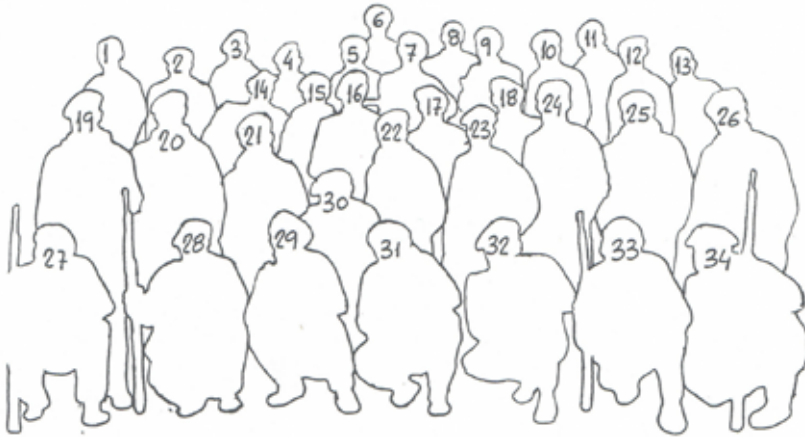
Miembros de la Compañía Horn, 3ª del batallón Gordexola Cuartel de Bidarte, Bilbao. Noviembre 1936