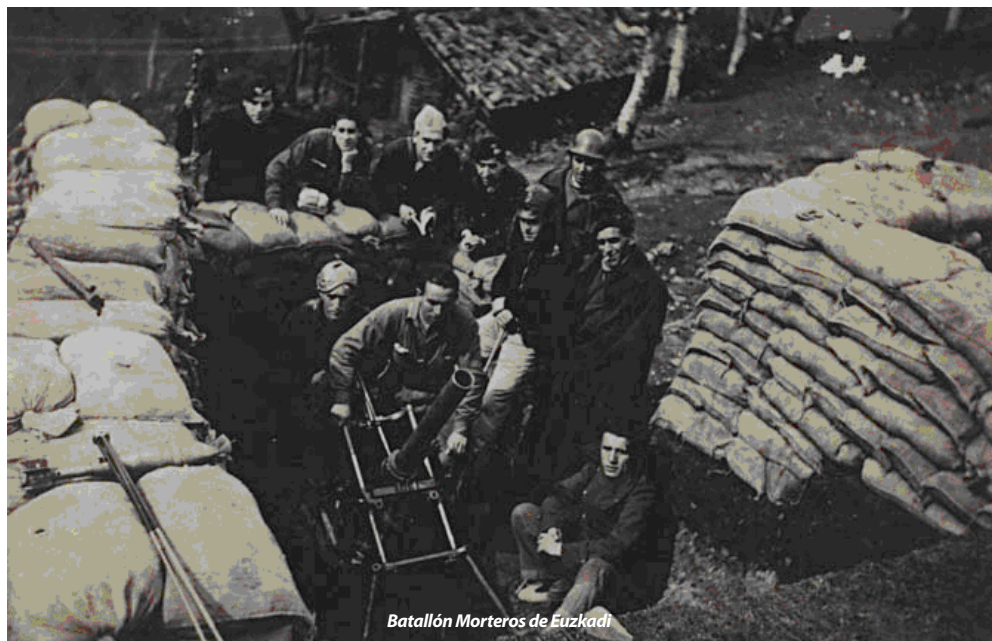
Batallón Morteros de Euzkadi

partidos y sindicatos. Un ejemplo, además vinculado a Barakaldo, fue el del batallón Euzkadi de Morteros. Organizado como fuerza regular, sus hombres eran mayoritariamente de tendencia frentepopulista. Los actos de entrega de su bandera se celebraron en Barakaldo el 28 de marzo de 1937, en la plaza de los Fueros, en presencia de numeroso público y autoridades. Se alojó en el municipio, en las Escuelas de Altos Hornos y actuaría en las batallas de la campaña vasca 39 .