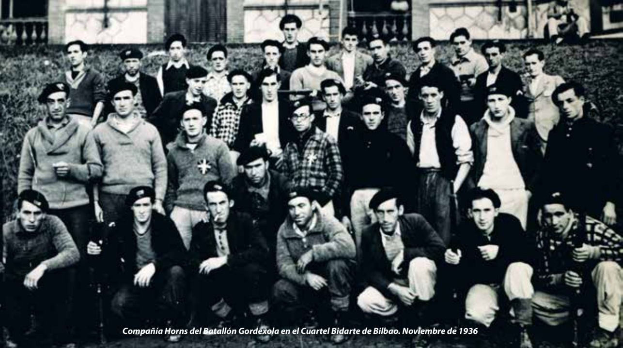
Compañía Horns del Batallón Gordexola en el Cuartel Bidarte de Bilbao. Noviembre de 1936

Al estallar el conflicto, los nacionalistas vascos de Barakaldo tuvieron como preocupación mantener el orden público, intentando evitar excesos.