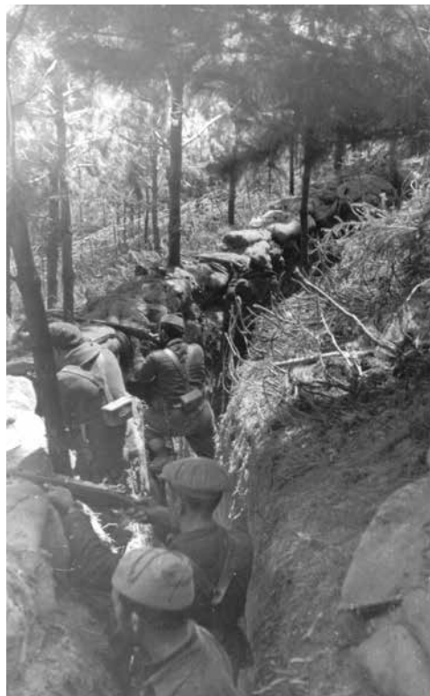
Trinchera del Batallón Celta en Larrabetzu.